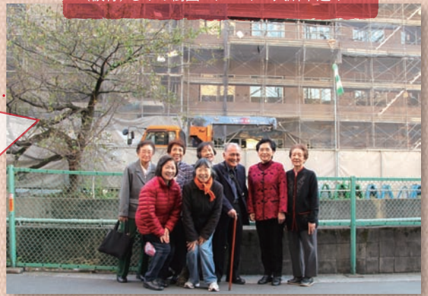
区内最大の特別養護老人ホーム (仮称)もみの樹園12/1~2/27入所申込み