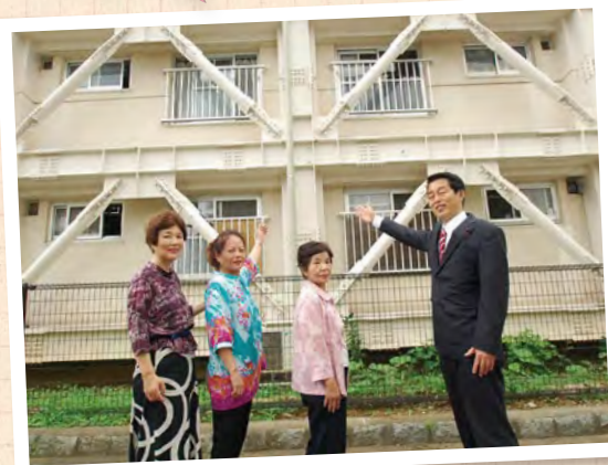
戸山ハイツと学校施設の 耐震化を推進