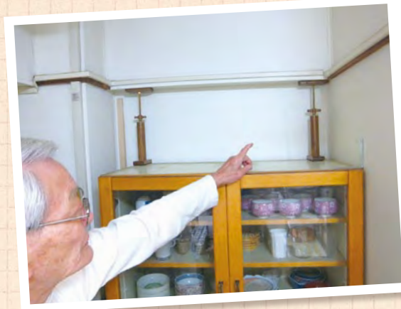
家具類転倒防止器具の無料相談・ 設置を実現