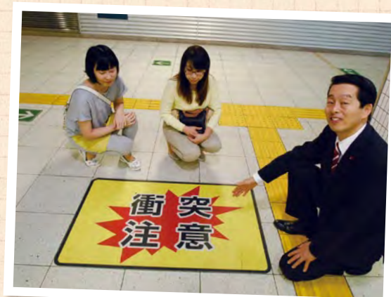
若松河田駅通路に衝突防止の シールを貼付