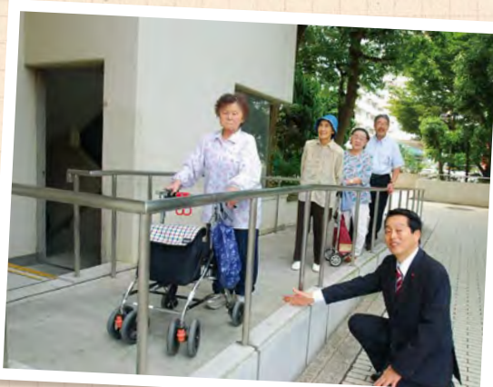
大久保3丁目アパートに スロープを設置